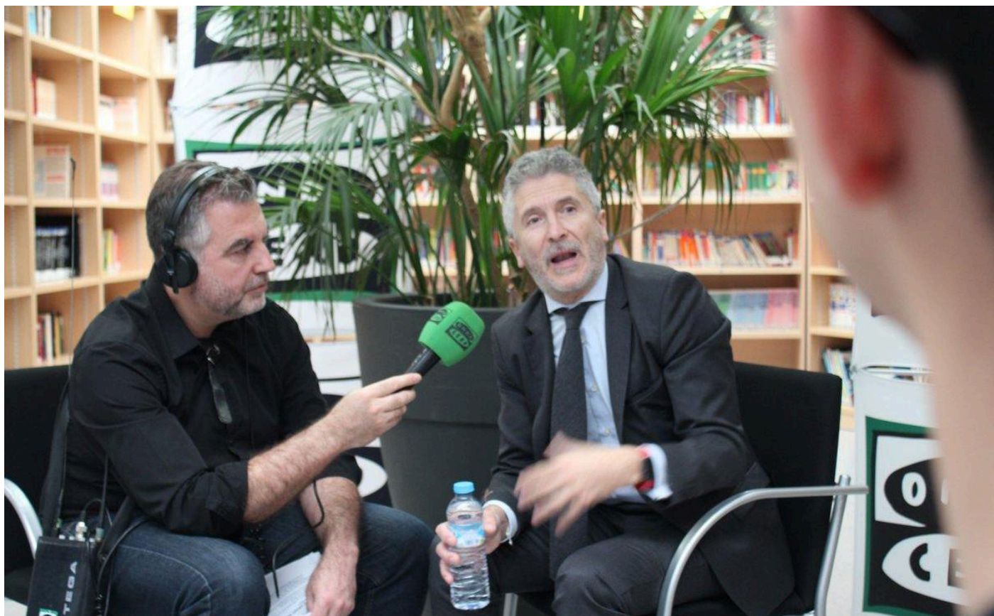
Grande Marlaska charla con los alumnos del colegio