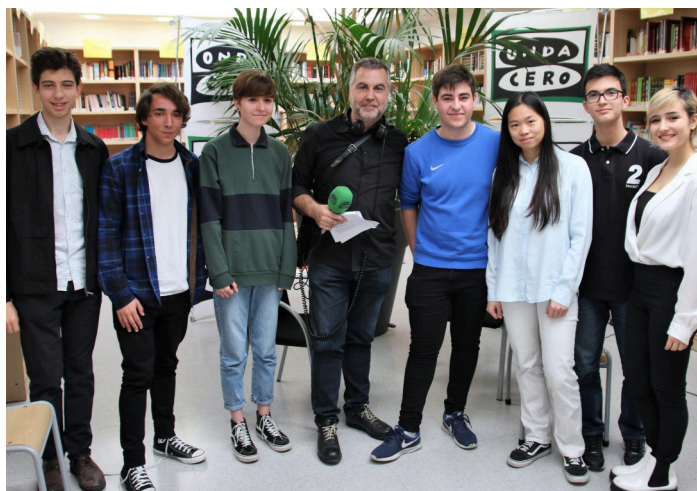
Los alumnos de Bachillerato posan con Carlos Alsina después de la entrevista

Asimismo, "nuestros" periodistas se convierten en tertulianos. Carlos Alsina les pregunta sobre qué saben ellos del 11 - M. Termina la entrevista. Terminan las intervenciones. Termina Alsina preguntándose en voz alta por qué estos alumnos no van a estudiar periodismo.